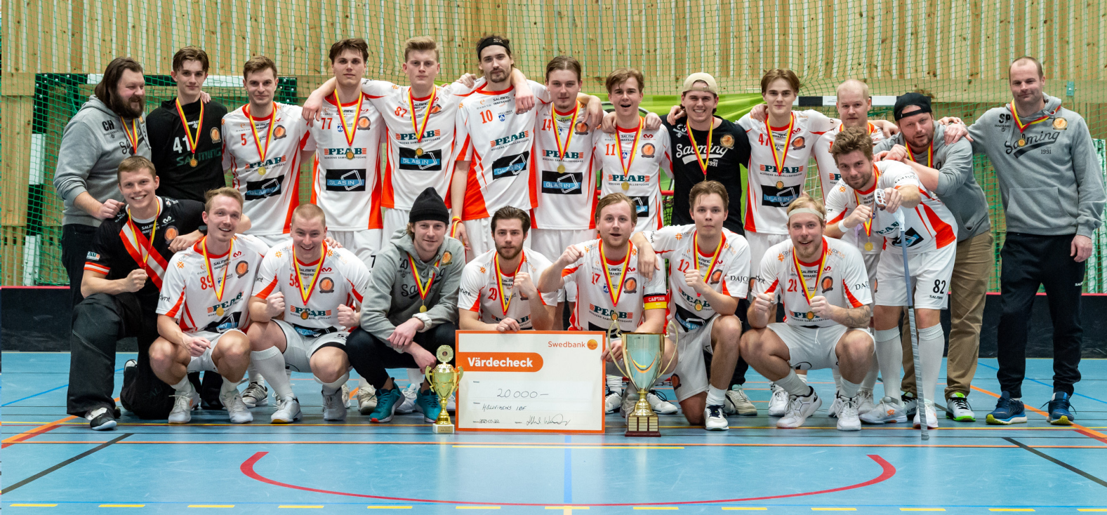
Höllvikens IBF tog hem segern i Skånemästerskapen herr säsongen 22/23.