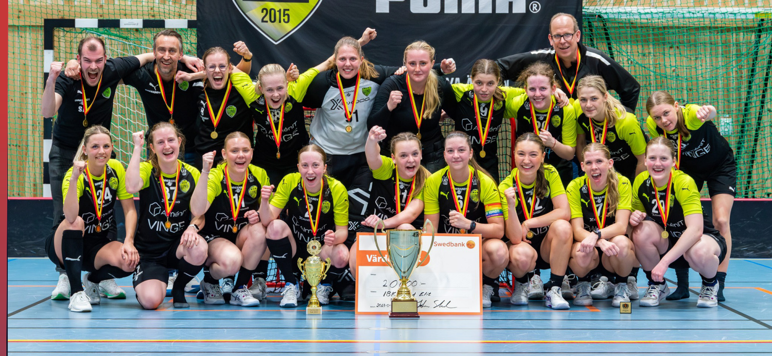
IBK Lund tog hem segern i Skånemästerskapen dam säsongen 22/23.